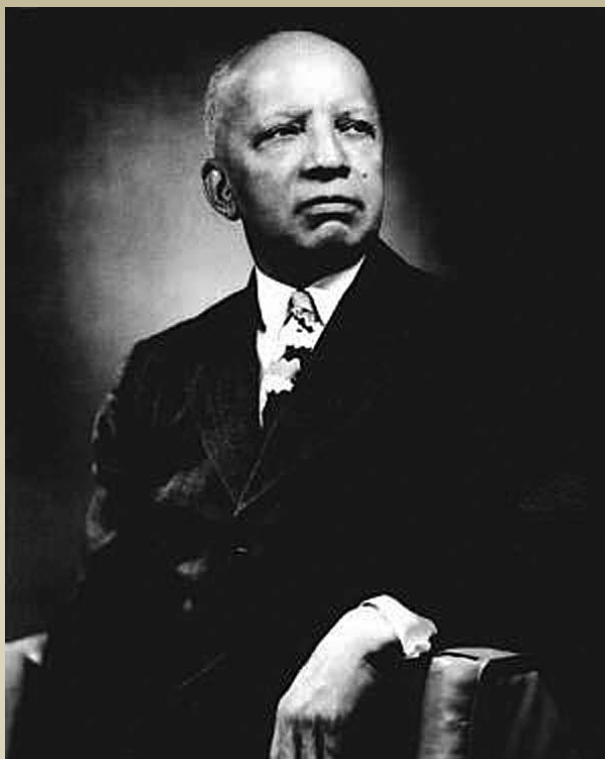
Carter G. Woodson

D'une part, la célébration du Mois de l'histoire des Noirs dans notre province sert à ouvrir le