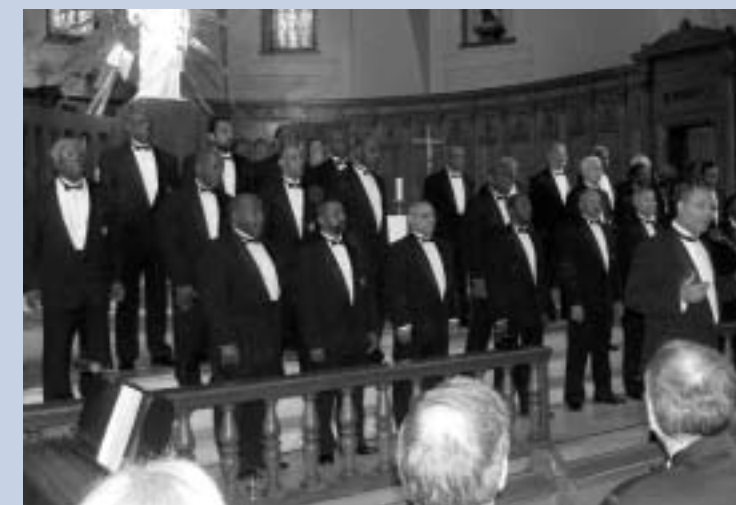
Le Men's Gospel Choir of the Union Church.

D'ici là, n'oubliez pas que vous êtes tous invités à entendre la Symphonie vocale lors de la traditionnelle messe de Noël, à la Fraternité, le 24 décembre à 20h.