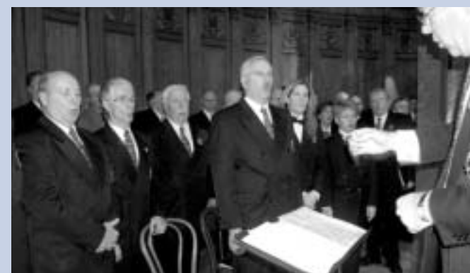
La Symphonie vocale de la Fraternité des policiers et policières de Montréal.

Cette année, le Service de police de la Ville de Montréal, la Symphonie vocale de la Fraternité des policiers et policières de Montréal, l'Association de bienfaisance et de retraite (ABR) et l'Association des policiers et policières retraités de Montréal (APPR) ont uni leurs forces pour contribuer aux célébrations soulignant simultanément trois événements : le Jour du souvenir 2004, le 100 e anniversaire de l'Oratoire St-Joseph et le 25 e anniversaire de l'arrivée des policières au Service.