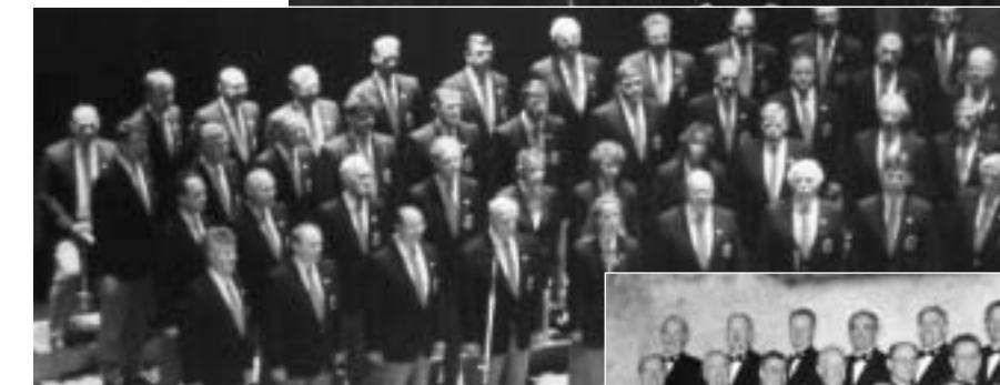
La Symphonie vocale lors de diverses prestations à des époques différentes.